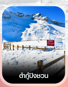
ต้ากู่ปิงชอน

✈️ คอนเฟิร์มออกเดินทาง ทุกพีเรียด 2 ท่านขึ้นไป