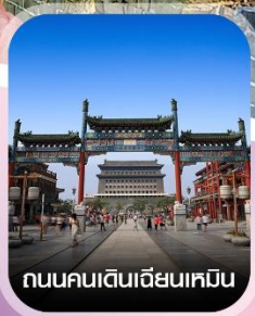
ถนนคนเดินเฉียนเหมิน

✈️ คอนเฟิร์มออกเดินทาง ทุกพีเรียด 2 ท่านขึ้นไป