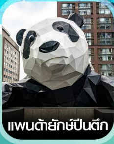
แพนด้ายักษ์ปิ่นตึก