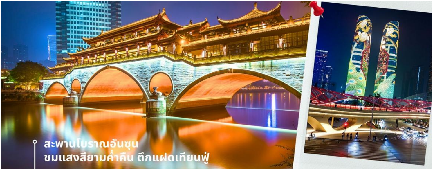
สะพานโบราณอันชุน ชมแสงสียามค่ำคืน ตึกแฝดเทียนฟู่

นำท่านชม สะพานโบราณอันชุน-พร้อมชมแสงสียามค่ำคืน ตึกแฝดเทียนฟู่ เป็นสะพานข้ามคลองที่สร้างเป็นเหมือนอาคารอยู่ข้างบน ในช่วงเวลายามเย็นจะเป็นช่วงที่ผู้คนออกมาชมบรรยากาศบริเวณของสะพานแห่งนี้ และมีร้านค้ามากมาย รวมไปถึงบาร์เครื่องดื่มต่างๆ ที่ดึงดูดนักท่องเที่ยวได้เป็นอย่างดี เป็นสะพานที่ทอดข้ามแม่น้ำจินเจียง และเป็นรูปแบบสะพานมีหลังคา ตามลักษณะสถาปัตยกรรมจีนโบราณ อายุมากกว่า 300 ปี และในบริเวณใกล้เคียงยังเป็นที่ตั้งของ ตึกแฝดเทียนฟู่ โดยในช่วงค่ำเวลา ประมาณ 19.00-22.00 น. ทั้ง 2 ตึกจะเป็นไฟ LED สวยงามโดดเด่นมาก ตึกแฝดเทียนฟู่ หรือที่เรียกอย่างเป็นทางการว่าตึกศูนย์การเงินนานาชาติเทียนฟู่ เป็นตึกระฟ้าที่สวยงามโดดเด่นสองตึกในย่านการเงินของเฉิงตู ตึกแต่ละตึกมีความสูง 58 ชั้นและสูงกว่า 700 ฟุต ตึกเหล่านี้โดดเด่นเป็นพิเศษด้วยภายนอกที่หุ้มด้วยไฟ LED ที่เป็นเอกลักษณ์ ซึ่งเปลี่ยนอาคารให้กลายเป็นจอภาพดิจิทัลขนาดใหญ่