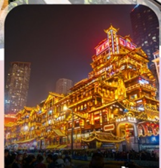
ตลาดหงหย่าตั้ง