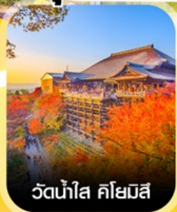
วัดน้ำใส ตีโยมัสึ

คอนเฟิร์มออกเดินทาง ทุกพีเรียด 2 ท่านขึ้นไป