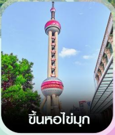
ขึ้นหอไข่มุก