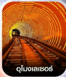
อุโมงเลเซอร์

✈️ คอนเฟิร์มออกเดินทาง ทุกพีเรียด 2 ท่านขึ้นไป