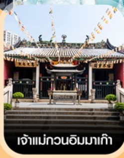
เจ้าแม่กวนอิมมาเก๊า

✈️ คอนเฟิร์มออกเดินทาง ✈️ ทุกพีเรียด 2 ท่านขึ้นไป