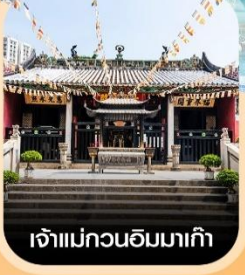
เจ้าแม่กวนอิมมาเก๊า