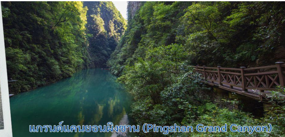
แกรนด์แคนยอนผิงซาน (Pingshan Grand Canyon)

เที่ยง รับประทานอาหารกลางวัน ณ ภัตตาคาร (6)