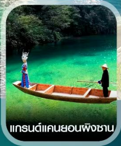
แกรนด์แคนยอนผิงชาน