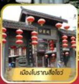
เมืองโบราณล่อซื่อ