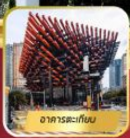
อาคารตะเกียบ