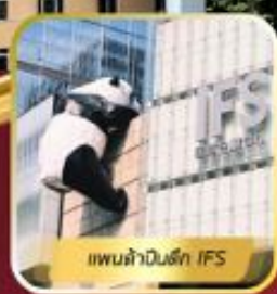
แพนด้าปาร์ค IFS