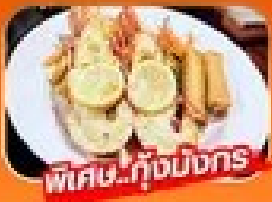
พิเศษ! กุ้งมังกร

1 - 5 เม.ย. / 29 เม.ย. - 3 พ.ค. 69 27 - 31 พ.ค. 69