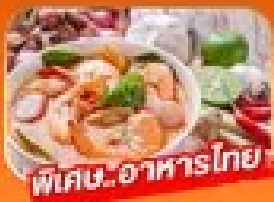
พิเศษ! อาหารไทย