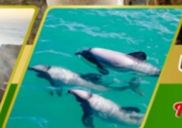
ล่องเรือชมโลมา