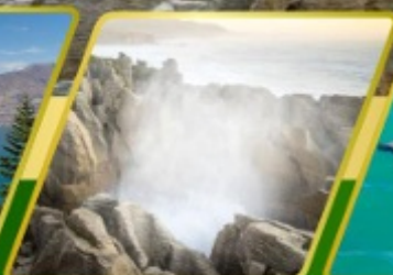
ไพล์, แพนเค้กโรค