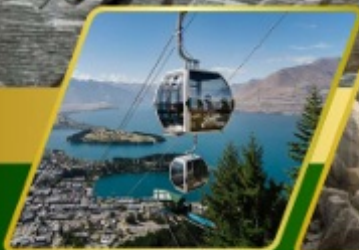
นั่งกระเช้ากอนโดล่า