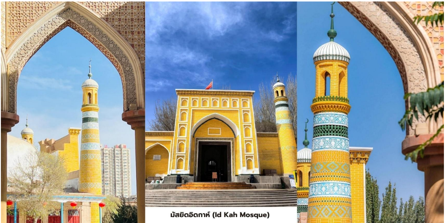
มัสยิดอิคคาห์ (Id Kah Mosque)

สมควรแก่เวลานำท่านเดินทางสู่ สนามบินคัชการ์ (Kashgar Airport) บินภายในประเทศกลับสู่ ซีหนิง