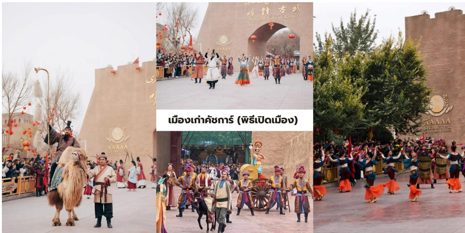
เมืองเก่าคัชการ์ (พิธีเปิดเมือง)

จากผ้าไหม Atlas และสวมหมวกดอกไม้ Doppa แถมนในบางช่วงการแสดงจะมีการแต่งกายเป็นนักรบโบราณที่มาพร้อมกับชุดเกราะแบบจัดเต็มด้วย สร้างบรรยากาศที่สะท้อนเอกลักษณ์ของวัฒนธรรมเอเชียกลางได้อย่างชัดเจน ในส่วนของพิธีนี้ จะจัดขึ้นในช่วงเวลาประมาณ 10:30 น. ของทุกวัน แนะนำให้มาถึงก่อนเวลาเล็กน้อยเพื่อเลือกมุมถ่ายภาพที่สวยงาม