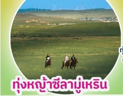
ทุ่งหญ้าซิลามูเหริน

ทุ่งหญ้าซิลามูเหริน - พิธีการขอพรจากโอวเบา - ปาร์ตี้กองไฟ - หมู่บ้านชนเผ่ามองโก สวนวัฒนธรรมมองโกเลียเหมิงเสียง - หุบเขาดอกแอปเปิ้ล - ทะเลทรายอินเคินทาลา แหล่งวัฒนธรรมมองโกเลียหยวนหลิว (รวมรถกอล์ฟ 2 ขา) - ตลาดกลางคืนเจียไท่ สวนวัฒนธรรมการแต่งงานสุดเอ็กซ์คลูซีฟแห่งเดียวในประเทศจีน บ้านองค์ปฐม - เซตการท่องเที่ยวเจงกิสข่าน-ถนนคนเดินคังปาซือ