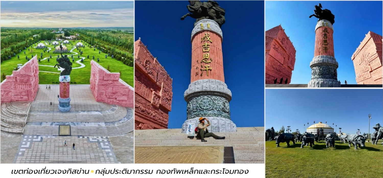
เขตท่องเที่ยวเจงกิสข่าน • กลุ่มประติมากรรม กองทัพเหล็กและกระโจมทอง