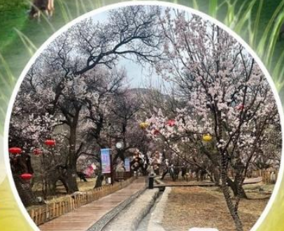
หุบเขาดอกแอปเปิ้ล