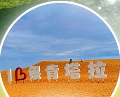
ทะเลทรายอินเคินทาลา