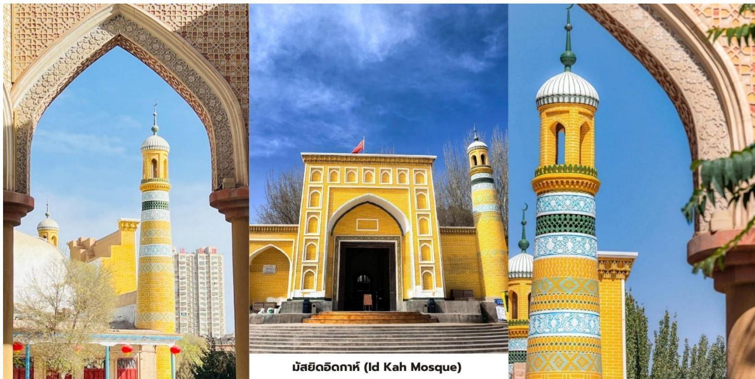
มัสยิดอิคคาห์ (Id Kah Mosque)

สมควรแก่เวลานำท่านเดินทางสู่สนามบินคัชการ์ (Kashgar Airport) ภายในประเทศสู่เมืองหลานโจว