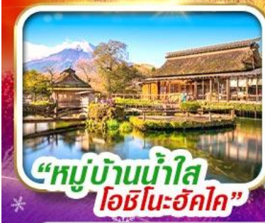
“หมู่บ้านน้ำใส โอชิโนะฮักโค”