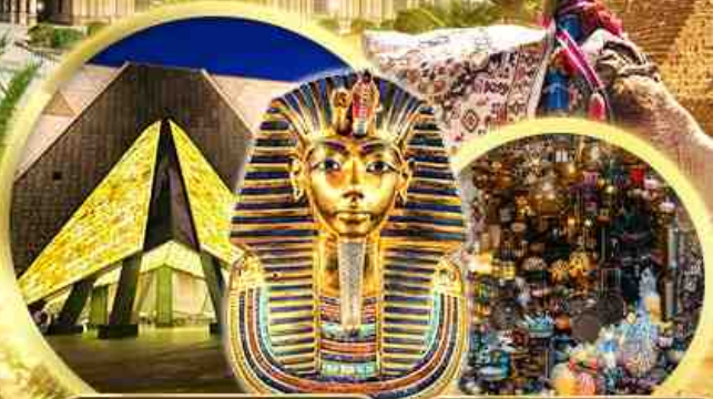
พิพิธภัณฑ์เกรนคียิปต์