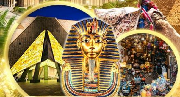
พิพิธภัณฑ์แกรนด์อียิปต์