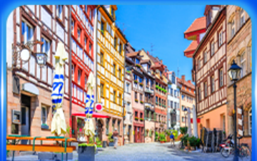
ย่านเมืองเก่า บูเรมเบิร์ก