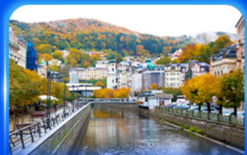
เมืองแห่งสา คาร์โลลวารี