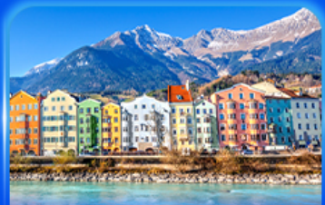
อาคารสีลูกกวาด อินส์บรุค