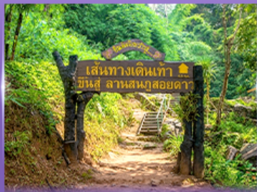
พีชพ 5 เป็นวัดใจ