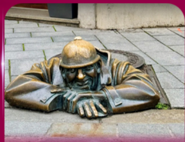
เซลฟี่คู่คูมิล บราติสลาวา