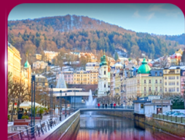
เมืองสปาแสนสวย คาร์โลว วารี