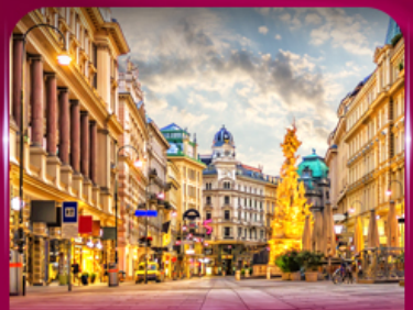
ชมเมืองโรมานติก เวียนนา