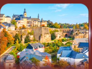
ย่านเมืองเก่า ลักเซมเบิร์ก