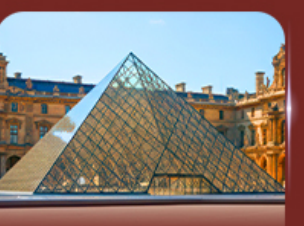
เซ็งอินพิพริกันท์ลูฟวร์ ปารีส