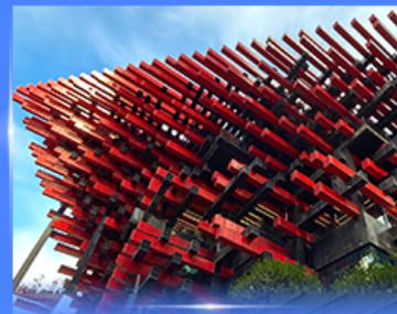
แลนด์มาร์คตึก ตึกเตเกียบ