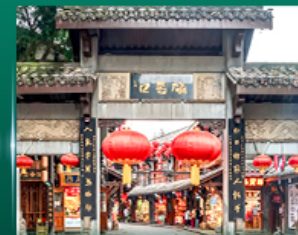
ช้อปปิ้งย่านเจียงฟางเมย์