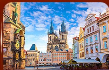
ชมย่านเมืองเก่า ปรากา