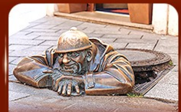
แลนด์มาร์คดัง รูปปั้นคูนิล Bratislava