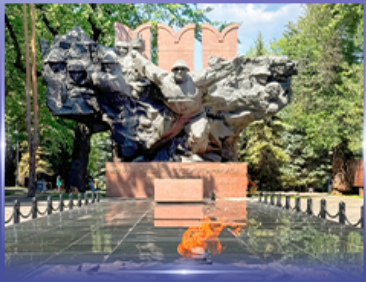
สวนสาธารณะ 28 Panfilov Park