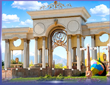
สวนสาธารณะประธานาธิบดี