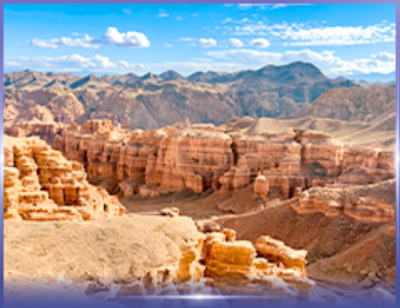
หุบเขาชาริน แคนยอน