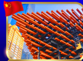
เขาคินตึกตะเกียบ