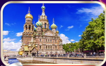
โบสถ์แห่งหยดเลือด