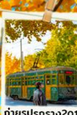
ถ่ายรูปปรกราง201