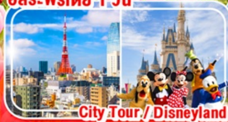
City Tour / Disneyland