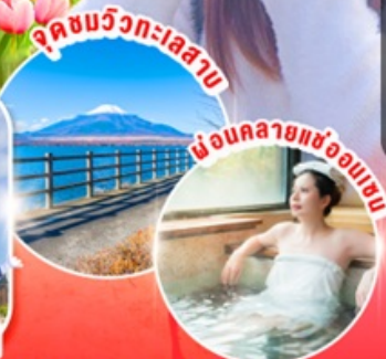
จุดชมวิวกะเลสาบ