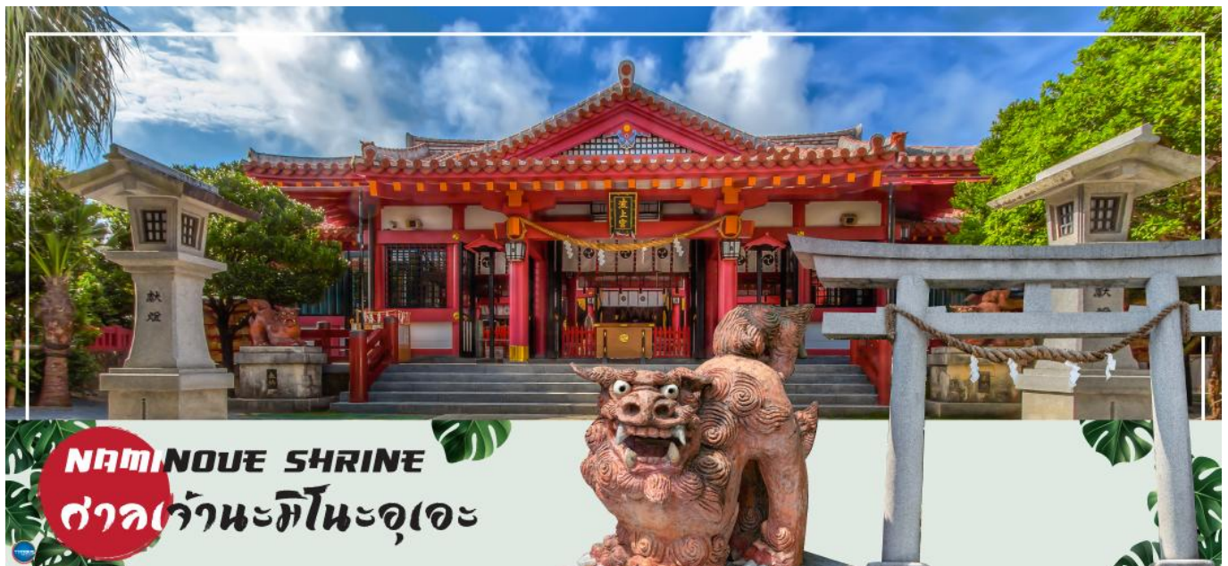
NAMINOUE SHRINE ศาลเจ้านะมิโนะอุเอะ

วันที่สี่ ศาลเจ้านามิโนะอุเอะ – ห้างสรรพสินค้า พาร์โค ซิตี – ทำอากาศยานนาสะ โอกินาวา – ทำอากาศยานดอนเมือง กรุงเทพฯ