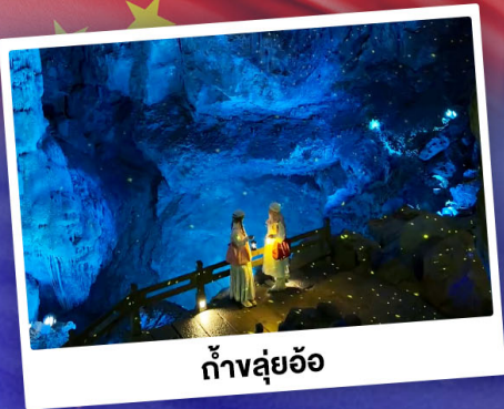
ถ้ำลู่อ้อ

"ดินแดนแห่งสาขน้ำและภูเขา" สัมผัสประสบการณ์นั่งบอลลูนชมวิวมุมสูง