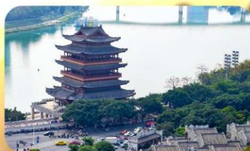
ถนนสามสายสองนคร