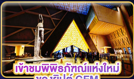
เข้าชมพิพิธภัณฑ์แห่งใหม่ ของอียิปต์ GEM