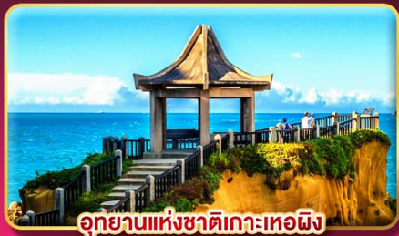
อุทยานแห่งชาติเกาะเหอผิง

ชมพลุข้ามปีฉลองเทศกาลปีใหม่ 2027 แช่น้ำแร่ส่วนตัวในห้องพัก