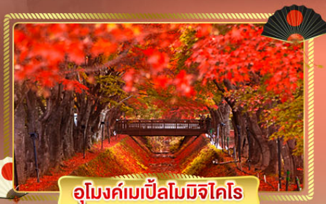
อุโมงค์เมเปิ้ลโมมิจิโคโร