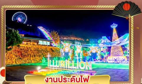
งานประดับไฟ Sagamiko Illumination

ชมความสวยงามแห่งเมือง อิบารากิ เที่ยวครบทุกวัน ฟังเสียงคลื่นซัด ณ เสาโทริอิกลางโหนดหิน