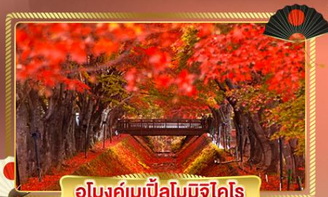
อุโมงค์เมเปิ้ลโมมิจิโคโร