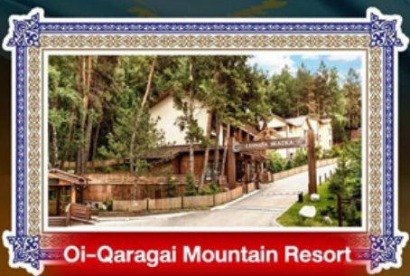
Oi-Qaragai Mountain Resort