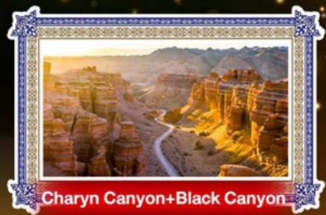
Charyn Canyon+Black Canyon