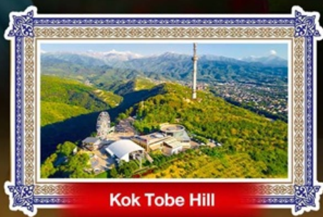
Kok Tobe Hill