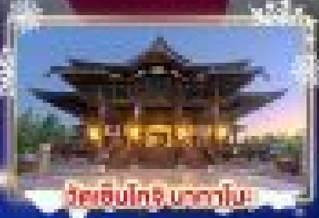
วัดเซ็นโซจิ โตเกียว