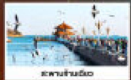
สะพานเทียนถัน