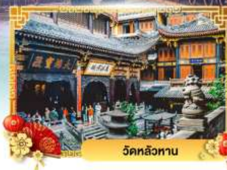
วัดหลัวหลาน