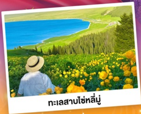
ทะเลสาบโซห์ลีมู่

ถ่ายรูปทุ่งดอกลาเวนเดอร์ - ทุ่งหญ้าคาลาจั้น SKY GRASSLAND ทุ่งหญ้ามรดกโลก