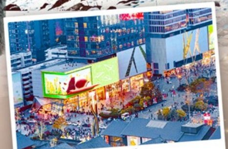
ถนนไท่กู๋หลี่หลิน