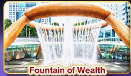
Fountain of Wealth