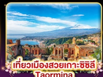
เที่ยวเมืองสวยเกาะซซิลี Taormina