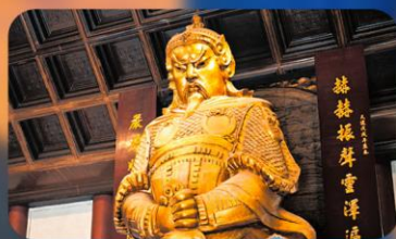
วัดเซ่งกงหมิว