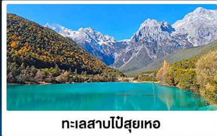
ทะเลสาบโป๋ส่วยเหอ