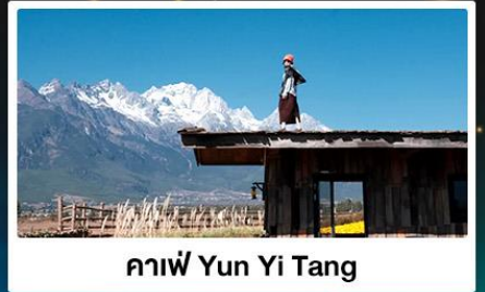
กาแฟ Yun Yi Tang