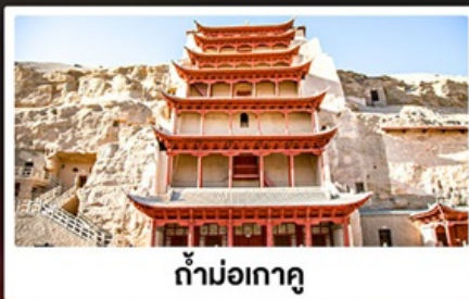
ถ้ำม่อเถาตู