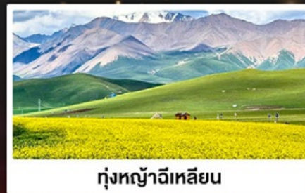
ทุ่งหญ้าฉีเหลียน