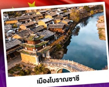
เมืองโบราณซาซี

ชมดอกไม้บานสะพรั่งทั่วยูนนาน "เซ็ดอี่แฉดาเฟ้ววี่สุดอลัง"