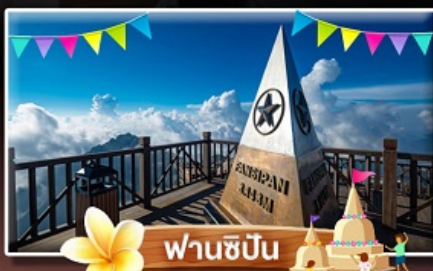
ฟานชิปัน