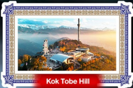
Kok Tobe Hill