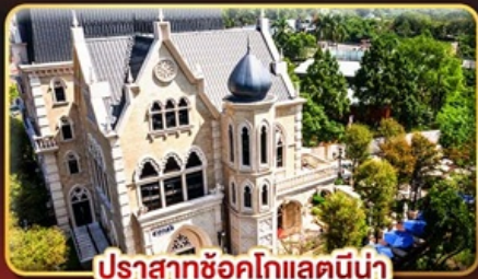
ปราสาทซ็อคโกแลตน้ำ