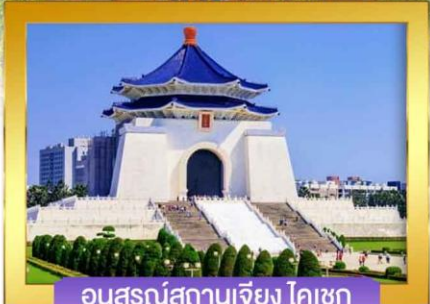
อนุสรณ์สถานเจียง ไคเชก